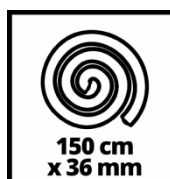
150 cm x 36 mm