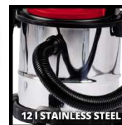
12 L STAINLESS STEEL