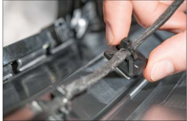
Quadratische SolidTack MB Sockel - schraubbar, selbstklebend - geeignet für eine Vielzahl von Anwendungen wie die Befestigung von Kabeln in der Automobiltechnik.