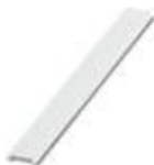
Zackband flach, Streifen, bestellbar: streifenweise, weiß, beschriftet nach Kundenangaben, Montageart: verrasten in flacher Schildchennut, für Klemmenbreite: 6,2 mm, Schriftfeldgröße: 5,15 x 6,15 mm, Anzahl der Einzelschilder: 10

Marker für Klemmen - UC-TMF 6 CUS - 0824646